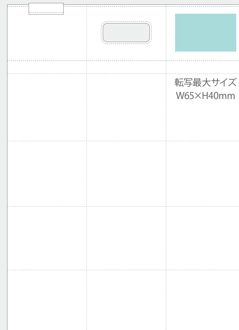
転写_表 (転写の場合は表のみ)