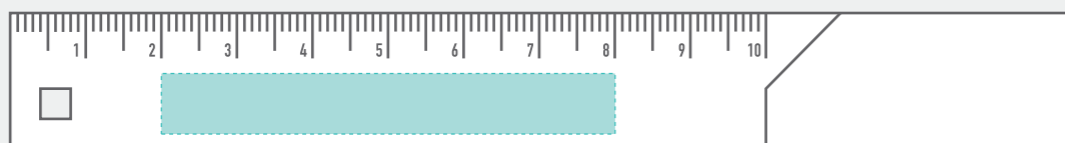
レーザー・パッド印刷 W60×H8mm