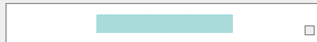
レーザー・パッド印刷 W60×H8mm