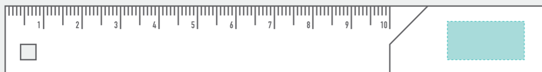
レーザー・パッド印刷 W20×H10mm