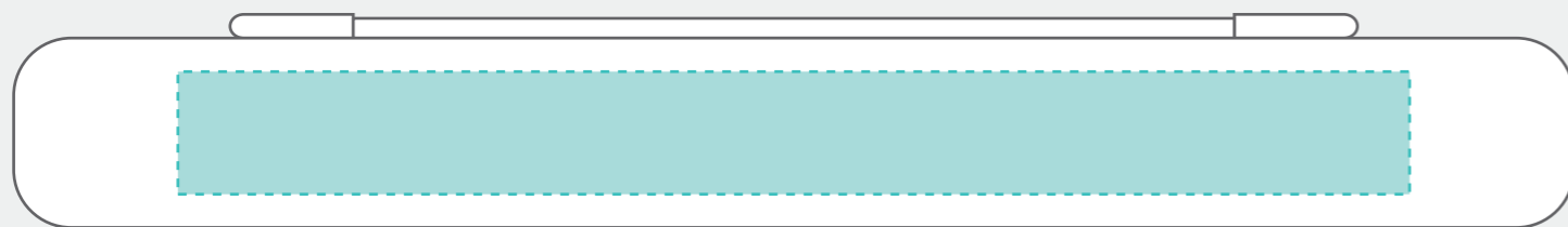
シルク・インクジェット印刷範囲 W150×H15mm