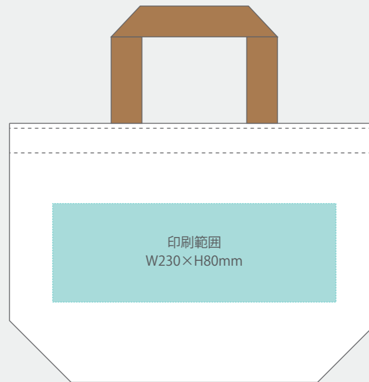
▼横中タイプ 印刷範囲 A