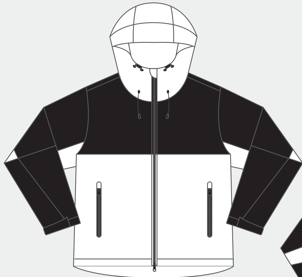
【 FRONT 】