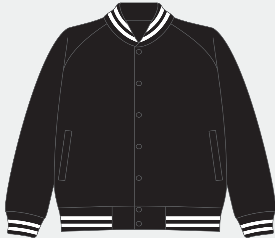
【 FRONT 】