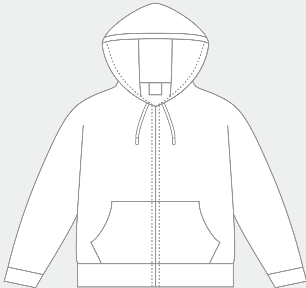
【 FRONT 】