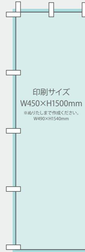
【スリムショートのぼり】