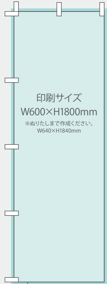
【レギュラーのぼり】