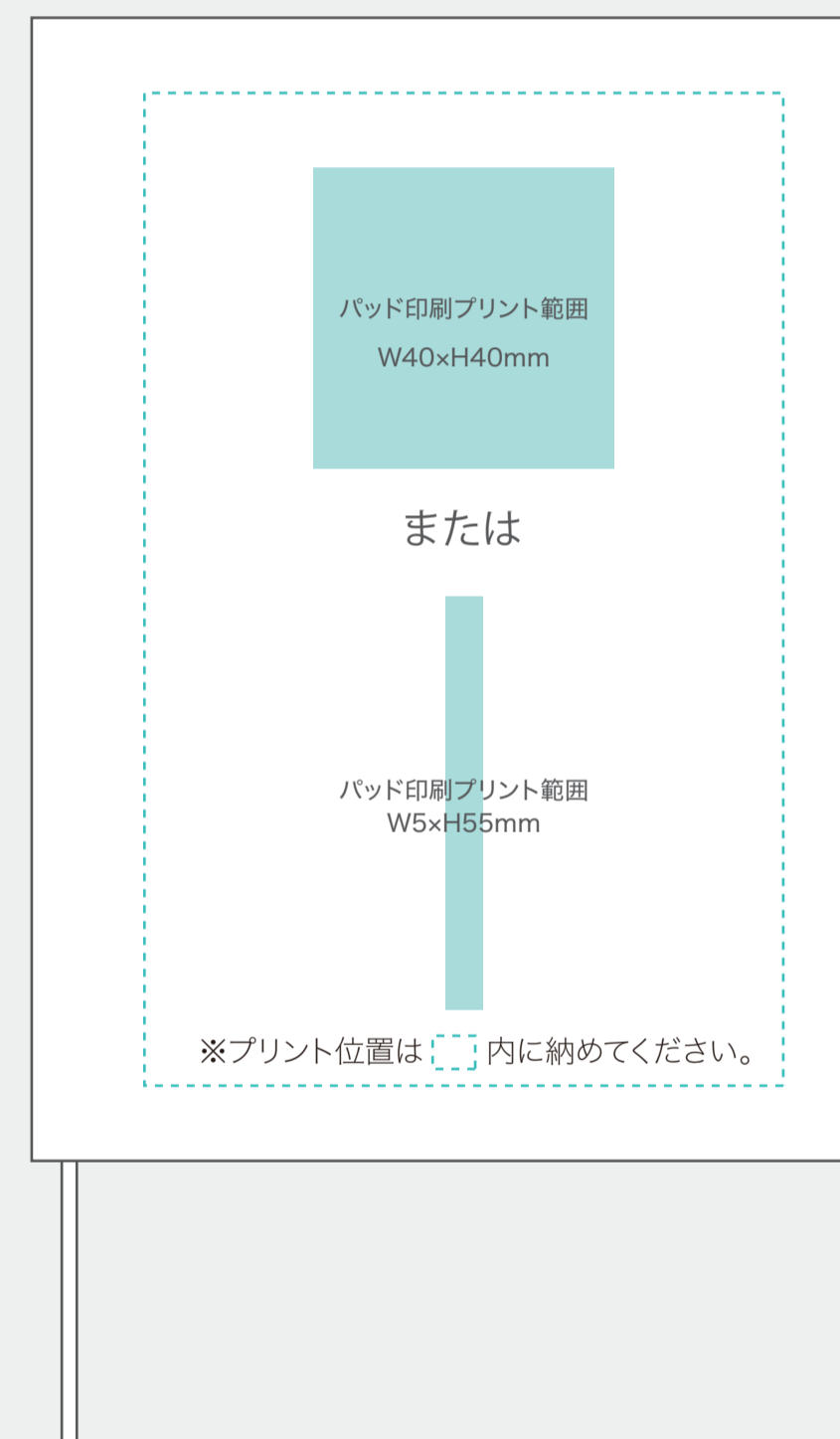
【表・裏パッド印刷範囲】