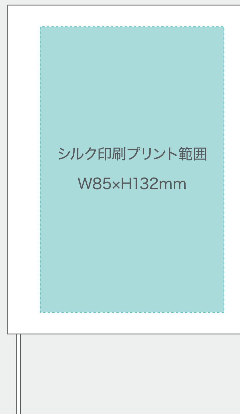
【表・裏シルクプリント範囲】